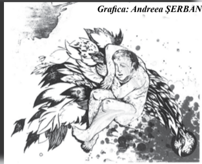
Grafică: Andreea ȘERBAN

Mă arde o privire din sfinxul tăcut Ard ruguri aprinse de timpul trecut Un nor răzvrătit în noaptea de vară Îmi plânge iubirea cu ploaie amară.