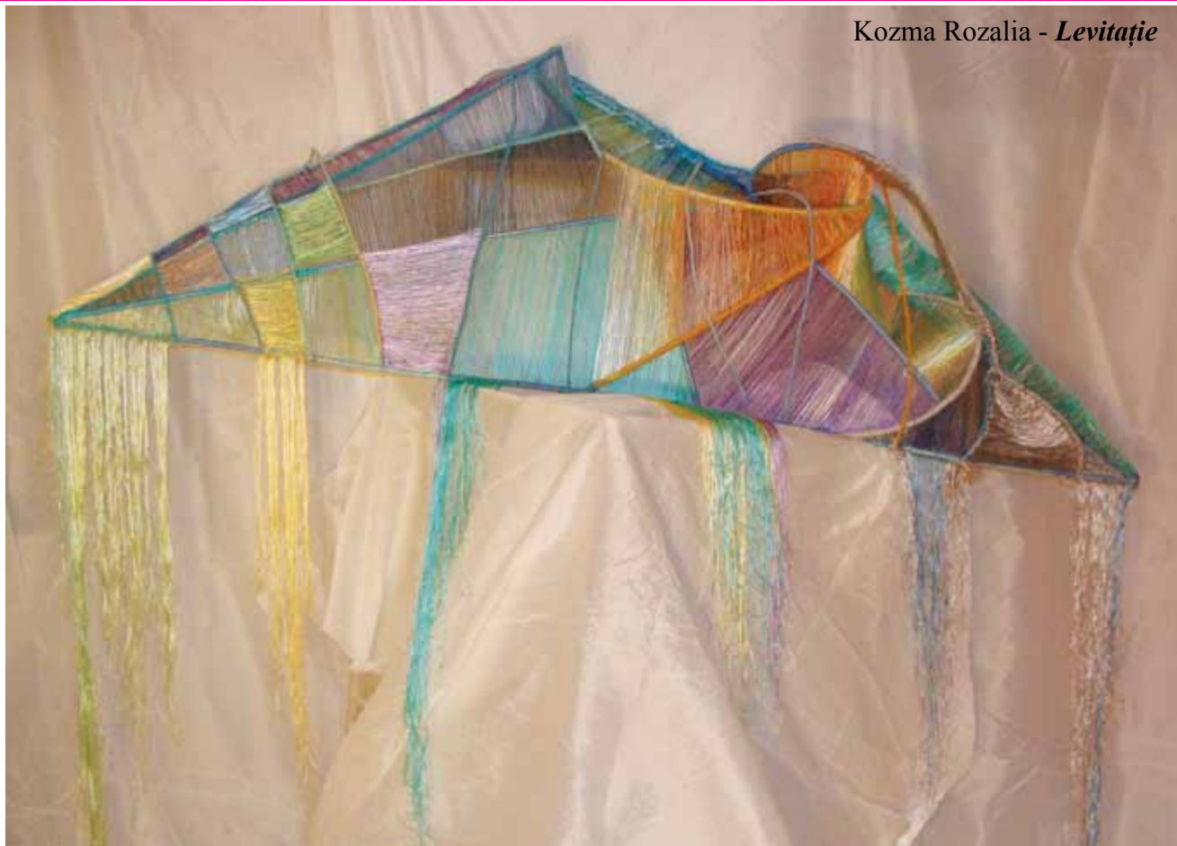
Kozma Rozalia - Levițiație

Fugim încărcăți cu valize de fum, Grăbiți să ne cernem pustiu de-acum, Se pierd amintiri într-o zare de cer Cuvânt ațipind într-o carte de dor.