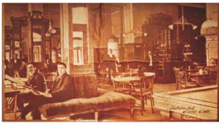
Cafeneaua Corso, Târgu-Mureș (perioada interbelică) - colecția de fotografii a Muzeului Jud. de Istorie Tg. Mureș

10. Orașul , anul IX, nr. 35, decembrie 1931, pp. 253-254.