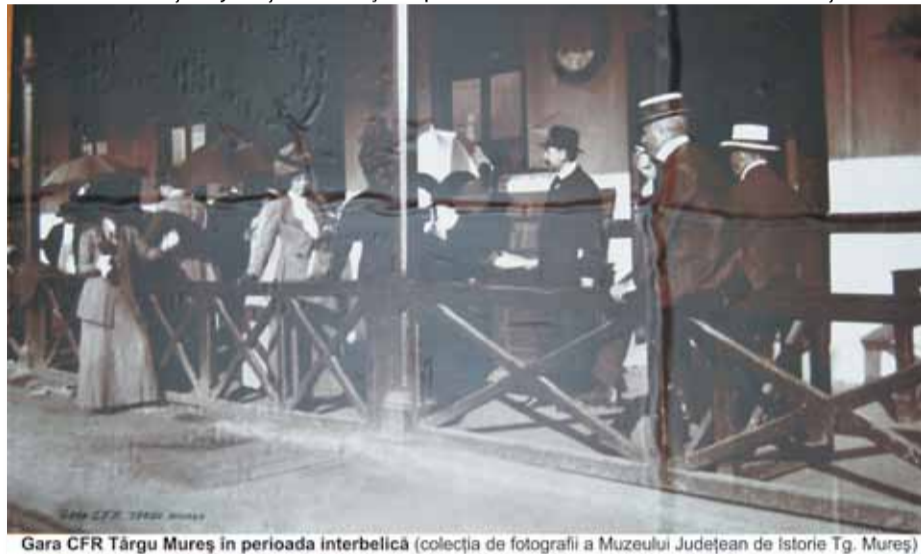
Gara CFR Târgu Mureș în perioada interbelică

Această situație a județului Mureș din punctul de vedere al căilor de comunicație nu era