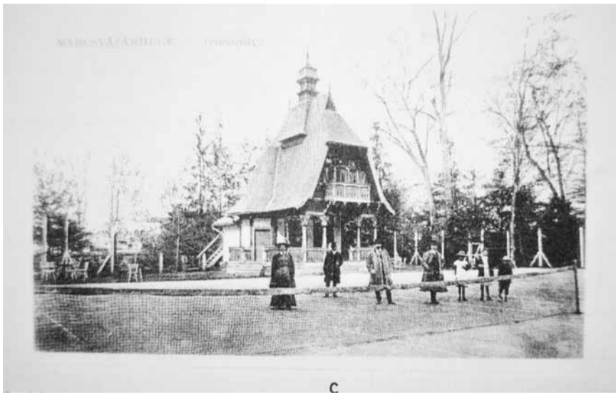
Pavilionul de tenis din cadrul Arenei sportive a Târgu-Mureșului interbelic