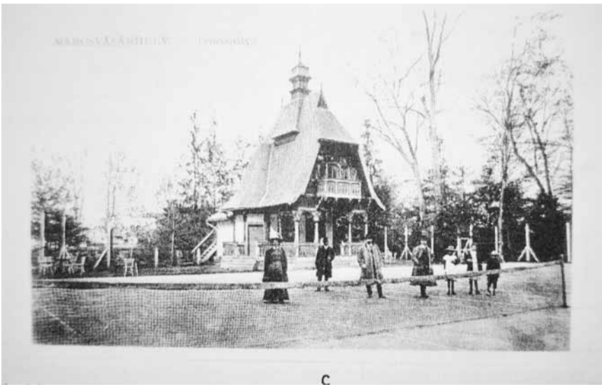
Pavilionul de tenis din cadrul Arenei sportive a Târgu-Mureșului interbelic