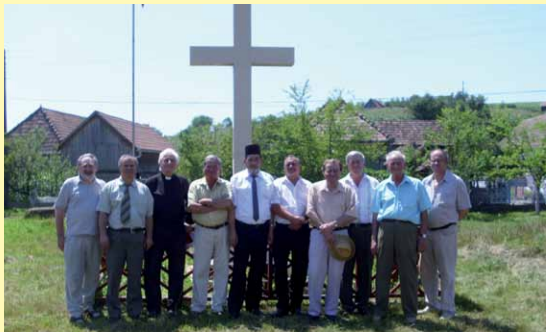
Instantaneu la Troița Eroilor din centrul satului Giuluș, cu participanții la prima ediție a manifestării (iulie 2010).