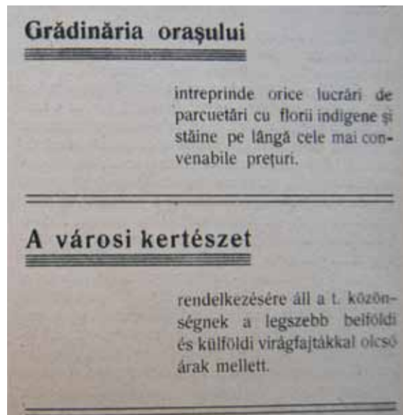
Ofertă a „Grădinăriei” Târgu-Mureș în publicația bilingvă a Primăriei, Orașul , anul I, nr. 3, 1 martie 1923, p. 48.

Era perioada în care renumele Târgu-Mureșului de „oraș al florilor” evolua spre cel de „orașul trandafirilor”, păstrat și azi prin impresionatele ronduri care întregesc imaginea orașului de primăvara până toamna.