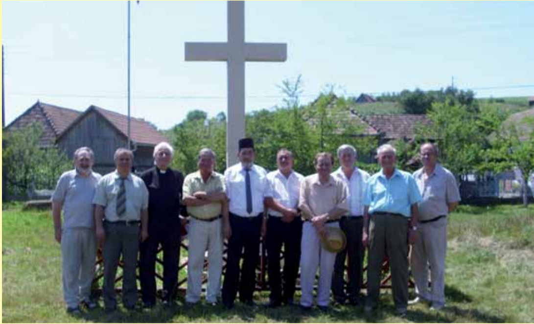
Instantaneu la Troița Eroilor din centrul satului Giuluș, cu participanții la prima ediție a manifestării (iulie 2010).