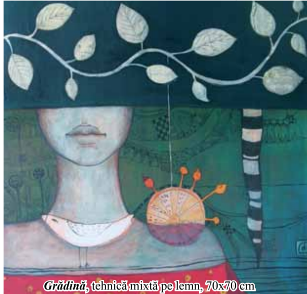
Grădină, tehnică mixtă pe lemn, 70x70 cm

Lucrările sale sunt axate pe tema intimității și a lumii văzute de aproape, în detalii ușor de neglijat de mintea grăbită în iureșul vieții, pe fragilitatea copilăriei trăită pe maidan, iar șarete, biciclete, dansatorii și saltimbancii, ferestre pentru înlesnirea accesului în lumea fanteziei și nu în ultimul rând șirurile infinite de case alcătuint așezări în miniatură sunt toate transfigurate în scene de un vădit caracter oniric. Cu ajutorul calităților scenografice, crează