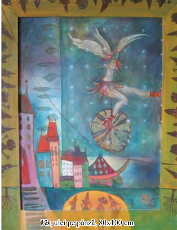
Viz, ulei pe pânză, 80x100 cm

Artista Măria Moldovan se revendică unui domeniu al artelor destul de greu accesibil datorită dificultății facerii obiectului de ceramică – începând cu lupta plămădirii materiei, trecând prin meșteșug și imaginație, până la struni-