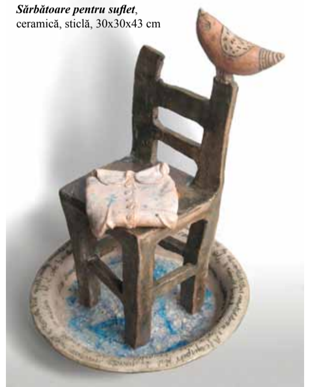
Sărbătoare pentru suflet, ceramică, sticlă, 30x30x43 cm