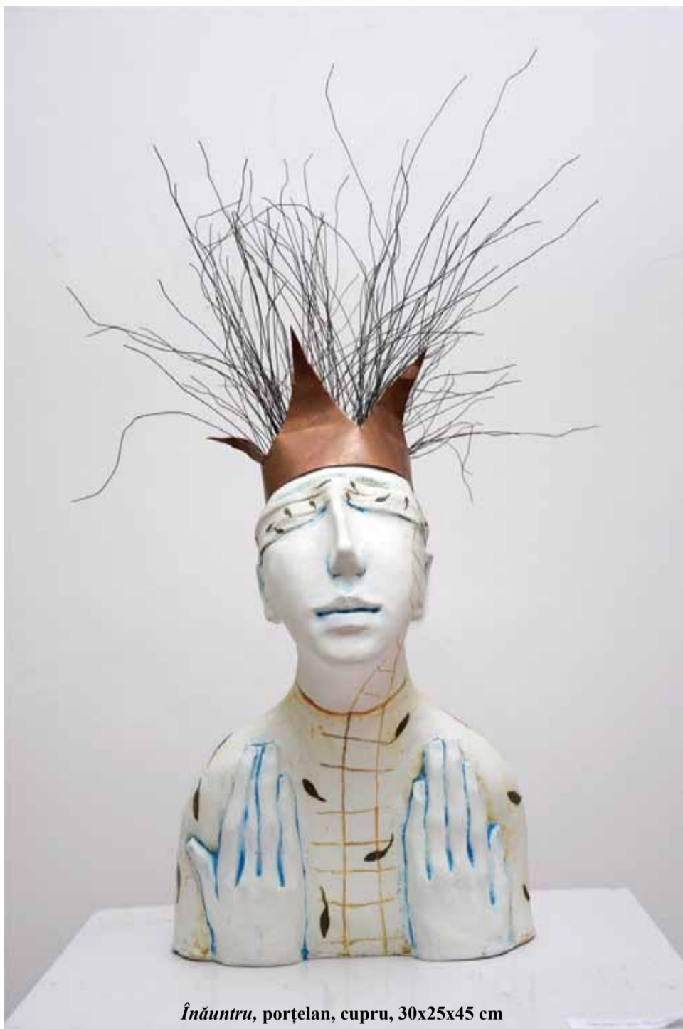
Înăuntru, porțelan, cupru, 30x25x45 cm