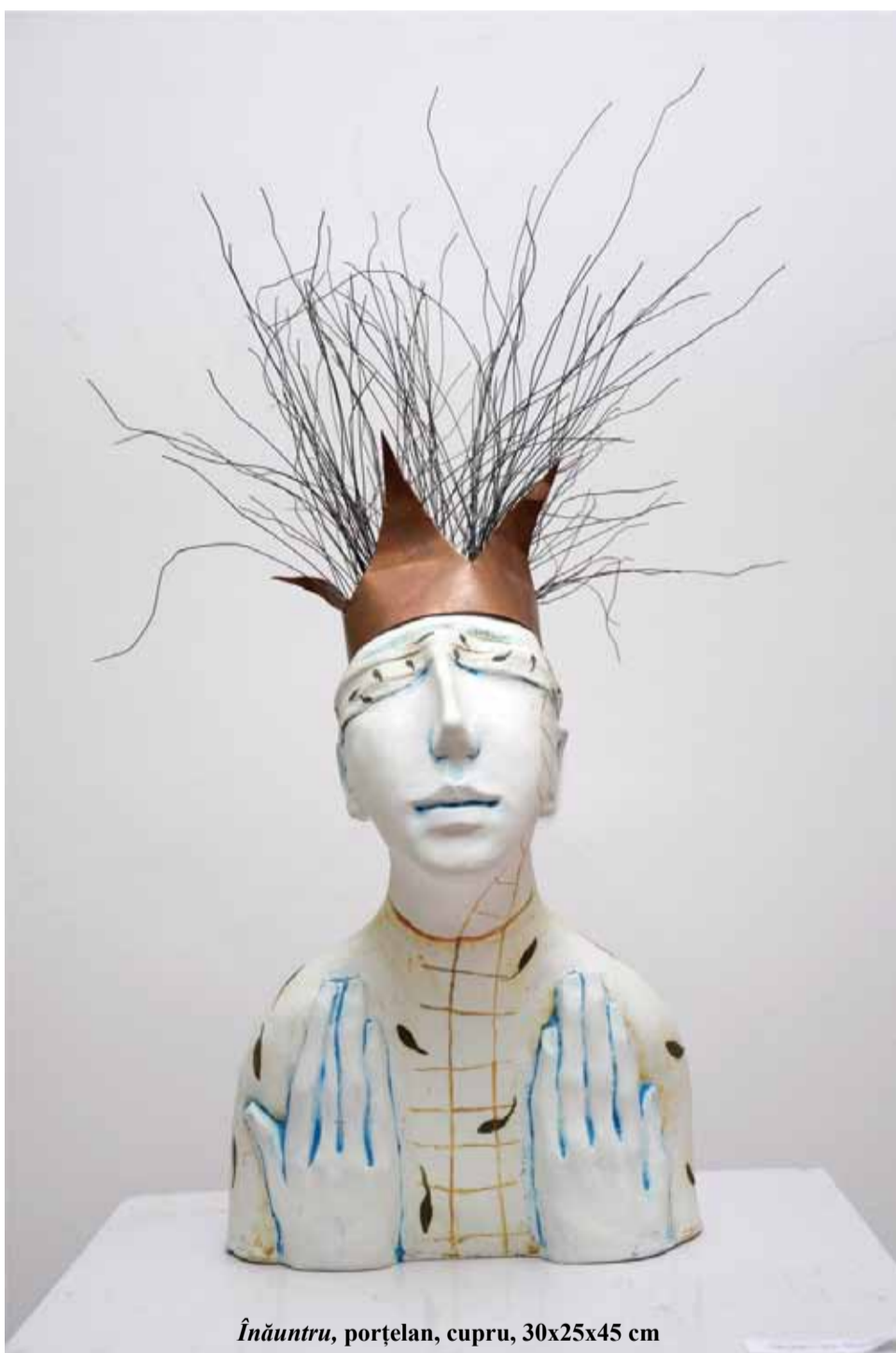
Înăuntru, porțelan, cupru, 30x25x45 cm