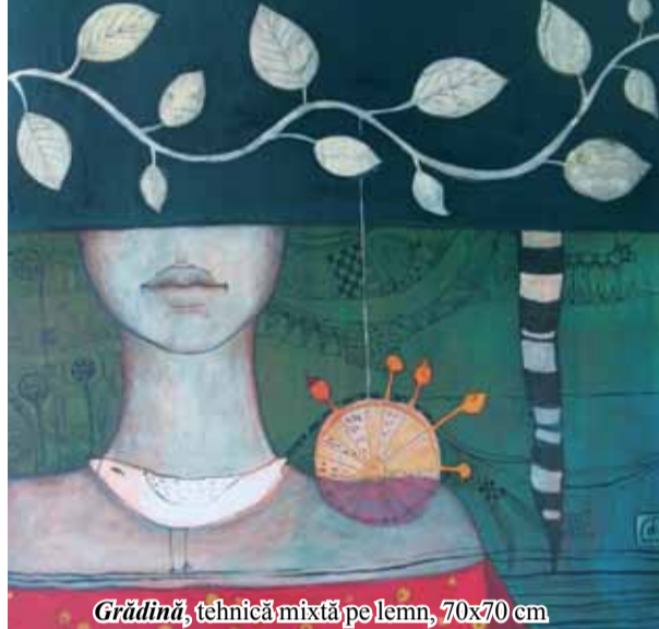
Grădina, tehnică mixtă pe lemn, 70x70 cm

Lucrările sale sunt axate pe tema intimității și a lumii văzute de aproape, în detalii ușor de neglijat de mintea grăbită în iureșul vieții, pe fragilitatea copilăriei trăită pe maidan, iar șarete, biciclete, dansatorii și saltimbancii, ferestre pentru înlesnirea accesului în lumea fanteziei și nu în ultimul rând șirurile infinite de case alcătuite așezări în miniatură sunt toate transfigurate în scene de un vădit caracter oniric. Cu ajutorul calităților scenografice, crează