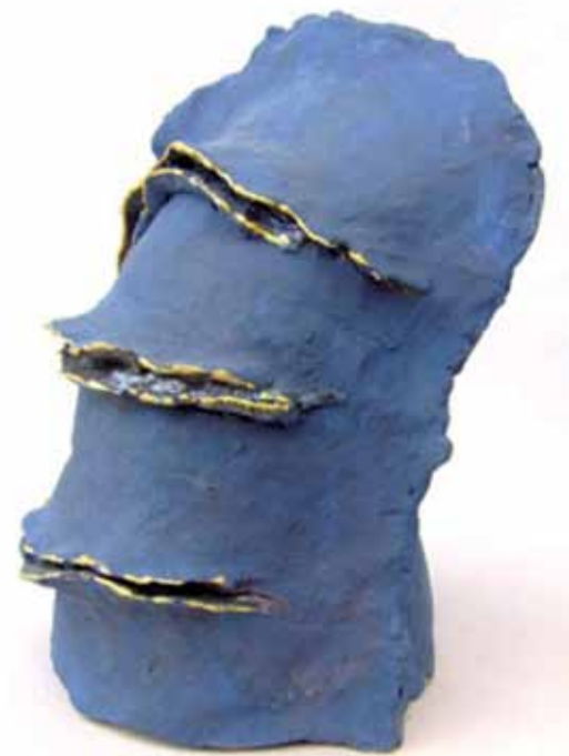
Transformed body 1

Desenele, schițele premergătoare lucrărilor Manei Bucur, trădează afinitatea pentru sculptură și pentru un delicat grafism, pe care-l regăsim condus cu abilitate în semnele caligrafiate pe